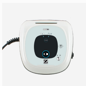
Unidad de control