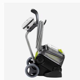
Carro de transporte